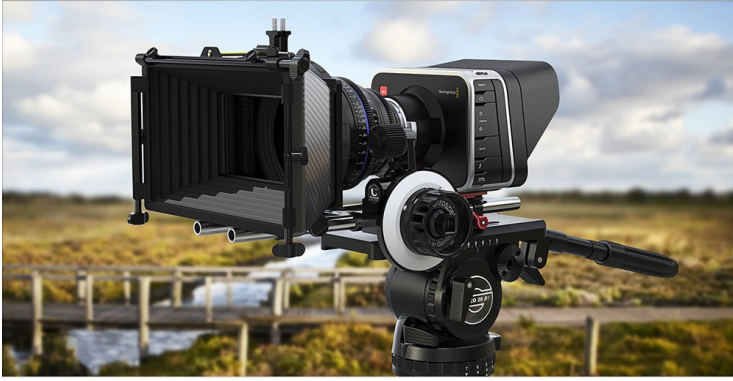
IMAGE Le tournage sera réalisé avec une équipe d'une dizaine de personnes, réalisateur, assistant réalisateur, chef opérateur caméra, directeur photo, ingénieur du son (enregistrement en stéréo), machiniste, éclairagiste, etc. Pour ce tournage, nous souhaitons une image qui se rapproche du grain cinéma, avec des couleurs réalistes.

Notre choix s'est donc porté sur la caméra cinéma de Blackmagic. Sa texture d'image est en parfaite harmonie avec notre histoire. L'image doit avoir autant de force, de caractère que notre thème.